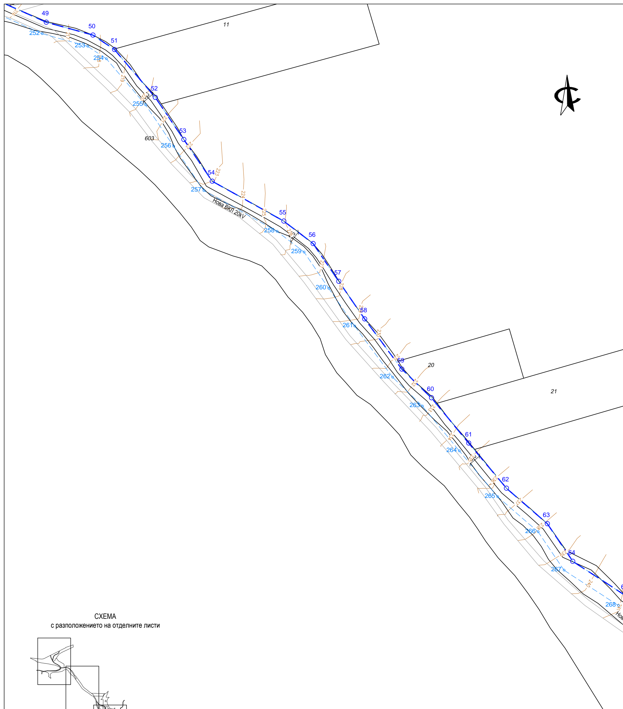
СХЕМА с разположението на отделните листи