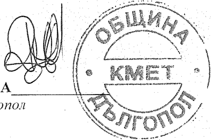
МАРИНКА ИВАНОВА Кмет на Община Дългопол

Заповедта подлежи на обжалване по реда на чл.215 ал.1 и ал.4 от ЗУТ в 14-дневен срок от нейното съобщаване пред Административен съд - гр.Варна чрез Община Дългопол.